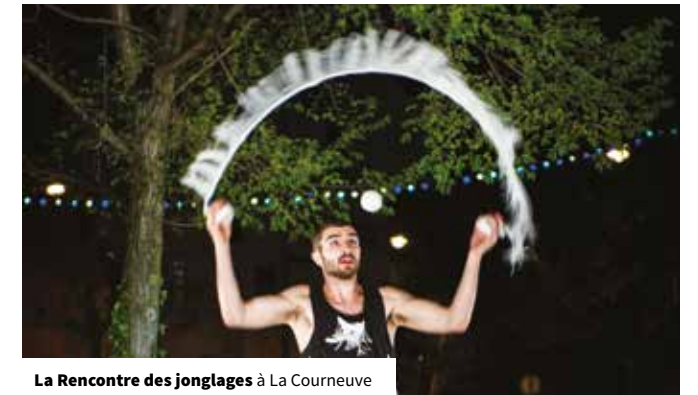
La Rencontre des jonglages à La Courneuve

locales et la participation des habitants. Cette tradition d'accueil va être confortée par les JOP 2024. Il s'agit de saisir cette opportunité pour donner à voir les richesses patrimoniales et culturelles ainsi que l'offre de services du territoire (hébergements, restaurants...) pour inciter les visiteurs à prolonger leur séjour et augmenter ainsi les retombées économiques locales. La qualité de l'accueil devra aussi les inciter à revenir ultérieurement ou à parler positivement de Plaine Commune à leurs proches. La préparation des JOP 2024 commence dès à présent et elle s'accroîtra dans le Schéma 2022/2027, avec le souci constant d'associer les habitants et les acteurs locaux aux festivités et de les faire bénéficier au mieux des retombées de l'événement.