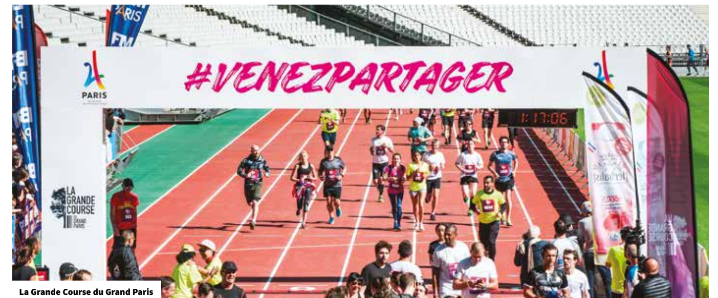
La Grande Course du Grand Paris

Le touriste se situe de base dans une forme d'insécurité et de vulnérabilité quand il voyage, dans la mesure où il se trouve loin de ses repères habituels (langue, culture, vie quotidienne...). Bien l'accueillir est une condition sine qua non pour le rassurer et lui permettre de profiter au mieux de son séjour. Bien reçu, un visiteur sera dans de bonnes conditions pour apprécier la visite ou la balade qu'il effectuera. Il sera incité à prolonger son temps de visite, à élargir le champ de sa découverte ou à revenir l'approfondir ultérieurement. Il s'en fera l'écho positif auprès de sa famille, de ses amis ou des réseaux sociaux dont on connaît l'importance aujourd'hui... en positif, comme en négatif. Contribuer au développement d'un territoire accueillant pour