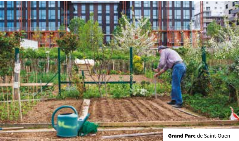
Grand Parc de Saint-Ouen