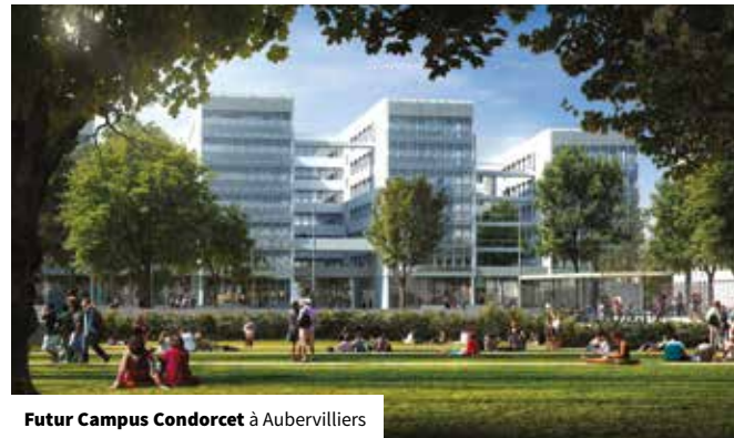
Futur Campus Condorcet à Aubervilliers