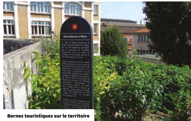
Bornes touristiques sur le territoire