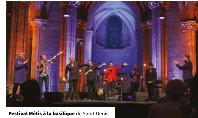
Festival Métis à la basilique de Saint-Denis

En matière de tourisme, l'intérêt des événements est de contribuer à dynamiser une destination en renouvelant l'offre et en créant un sentiment d'urgence à la visite. Pour Plaine Commune, l'avantage est d'autant plus important qu'un événement attire spontanément des milliers de visiteurs dans nos villes, alors même que la difficulté au quotidien est de faire exister notre offre à côté de l'offre parisienne, pléthorique, et de convaincre le public de franchir le périphérique. En matière d'accueil d'événements, Plaine Commune dispose déjà d'une forte expérience. La coupe du monde de football en 1998 (qui fête ses 20 ans en 2018), les championnats d'athlétisme en 2003 et la coupe du monde de rugby en 2007, ont dynamisé le territoire et constitué de beaux moments de convivialité. L'Euro 2016 a été plus décevant, notamment en raison du « mur » érigé entre le Stade et son quartier, ce qui a fortement limité les retombées