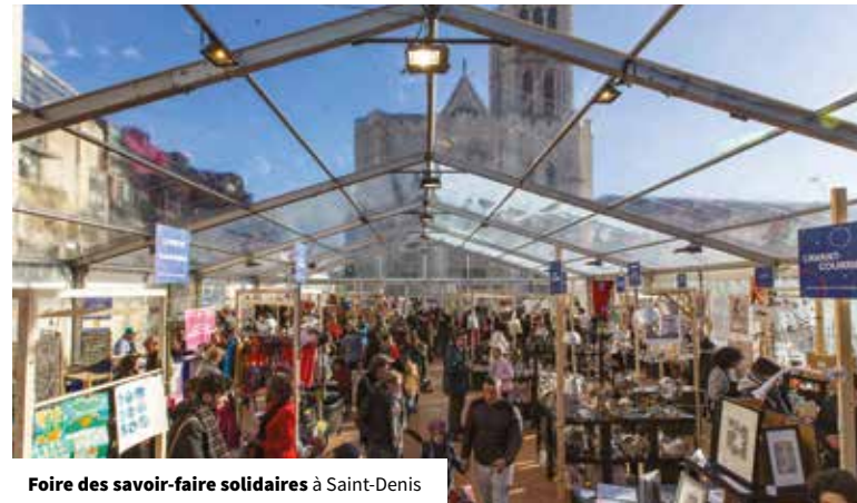
Foire des savoir-faire solidaires à Saint-Denis

Dans la continuité du précédent Schéma, il s'agit également de renforcer le rôle des « locomotives touristiques » que sont la basilique-cathédrale de Saint-Denis, le marché aux Puces de Paris Saint-Ouen et le Stade de France (action 2 : renforcer l'attractivité de la basilique de Saint-Denis / action 3 : renforcer la valorisation touristique du marché aux Puces de Paris Saint-Ouen / action 4 : relancer et développer le partenariat avec le Stade de France) . En effet, leur fréquentation est en-deçà de leur potentiel pour des raisons conjoncturelles (crise économique, attentats, ...) et structurelles (communication/promotion insuffisantes, environnement urbain parfois peu qualitatif...). Ainsi, on a comptabilisé 134 000 visiteurs en 2016 pour le joyau de l'art gothique qu'est la basilique cathédrale de Saint-Denis contre