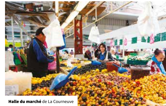
Halle du marché de La Courneuve

En ce qui concerne l'hébergement, l'objectif est d'accompagner le développement de l'offre d'un point de vue quantitatif et qualitatif, notamment en vue de répondre aux besoins liés à l'accueil des JOP 2024. On s'attachera à poursuivre la diversification de l'offre avec le développement d'hébergements moins standardisés et la création d'une auberge de jeunesse. On veillera également à renforcer l'ancrage local des acteurs (mise en relation avec des prestataires locaux) afin d'améliorer l'impact de la fréquentation touristique sur le développement local. Enfin, il s'agira d'encadrer le développement des plateformes dites collaboratives, telles que AirBnB, afin d'assurer une certaine équité avec les hébergements hôteliers (déclaration en mairie, collecte de la taxe de séjour) et de développer des partenariats pour valoriser les richesses du territoire via ces plateformes ( action 11 : accompagner les hébergements touristiques existants et les projets de développement ).