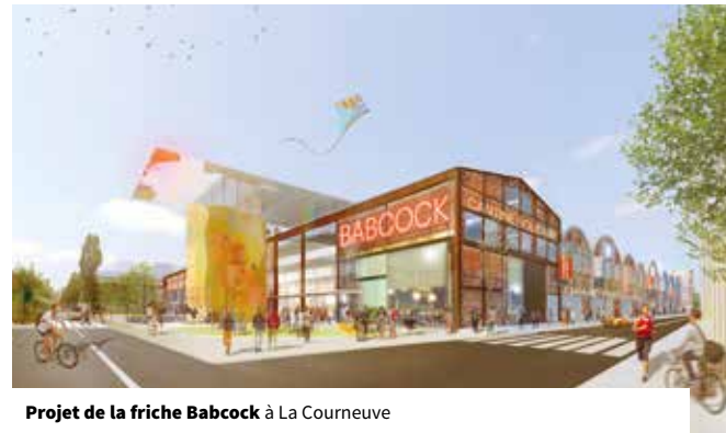
Projet de la friche Babcock à La Courneuve

On s'attachera également à renforcer la collaboration avec l'ensemble des services du département Développement et animation du territoire de Plaine Commune afin de mieux identifier les porteurs de projet dans le domaine du tourisme et de mieux les accompagner. En effet, l'évolution des attentes des touristes, l'essor des nouvelles technologies, le développement de l'économie dite collaborative entraînent l'apparition de nombreuses start-ups dans le secteur du tourisme. Dans ce travail d'accompagnement, une attention particulière sera portée aux acteurs de l'Économie Sociale et Solidaire ( action 15: améliorer l'accompagnement des porteurs de projets dans les domaines du tourisme et du patrimoine ).