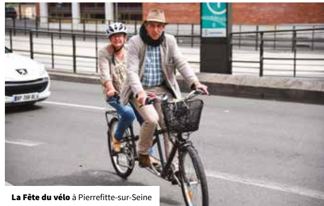
La Fête du vélo à Pierrefitte-sur-Seine