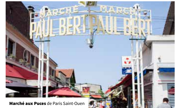
Marché aux Puces de Paris Saint-Ouen

Les échanges avec la population locale sont de plus en plus recherchés par les touristes. Il y a d'autant plus de sens à en faire un marqueur fort de Plaine Commune que l'histoire du territoire est traversée par une tradition d'accueil et d'ouverture aux étrangers. Il s'agit ici d'accompagner les professionnels, qu'ils soient directement liés au tourisme (agents d'accueil de l'Office de Tourisme Intercommunal, de sites patrimoniaux ou d'hébergements touristiques) ou indirectement (commerçants, restaurateurs, personnels de la RATP et de la SNCF...) pour améliorer la qualité de l'accueil des visiteurs : la mise en tourisme doit être une responsabilité davantage partagée. Il s'agit aussi de sensibiliser les habitants au rôle qu'ils peuvent jouer au quotidien dans leurs contacts avec les touristes pour les renseigner et les orienter. Dans ce domaine, la population de Plaine Commune aux 130 nationalités dispose d'atouts linguistiques indéniables qu'il convient de valoriser. Le « langage des signes » à la portée de tout un chacun peut par ailleurs s'avérer extrêmement efficace... pour peu qu'on soit dans une démarche d'ouverture à l'Autre ( action 13 : poursuivre la professionnalisation de l'accueil par les acteurs locaux et sensibiliser les habitants à l'accueil ).