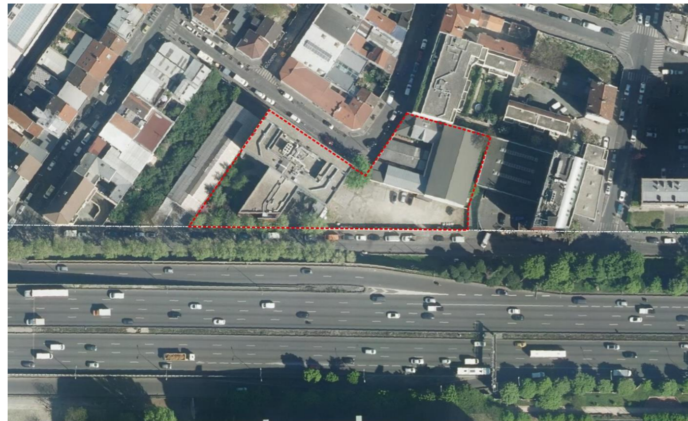
Casses, vue satellite et périmètre de l'OAP