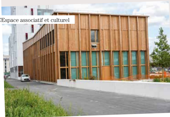
L'Espace associatif et culturel