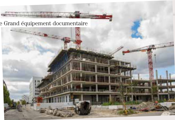
Le Grand équipement documentaire