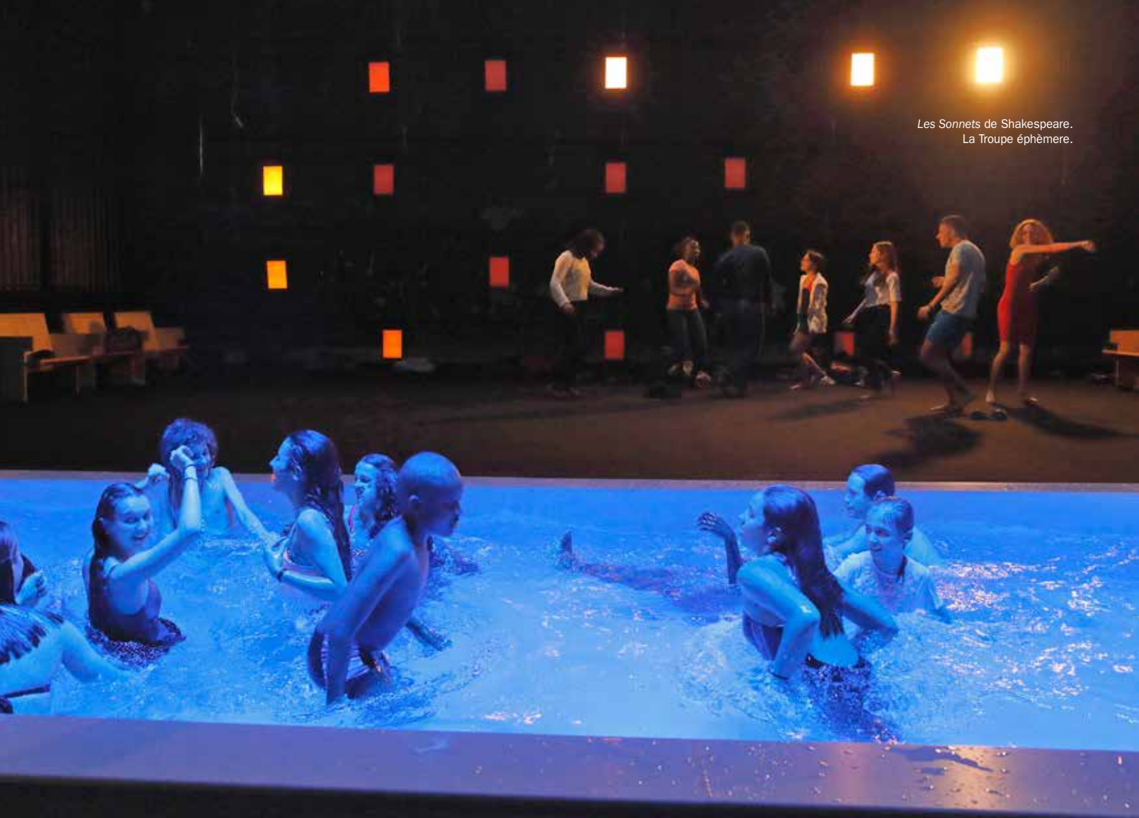
Les Sonnets de Shakespeare. La Troupe éphémère.