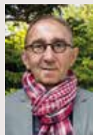
Dominique Carré Président du Groupe des Écologistes et Citoyens

La réponse aux maux de ce monde (réchauffement climatique, perte de la biodiversité...) est dans le local, la proximité et le lien social. C'est à ce niveau que peuvent être conçus les instruments efficaces pour répondre aux problèmes globaux. Comptez sur les écologistes pour des propositions en ce sens lors des élections municipales de 2020.