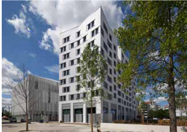
La Maison des chercheurs et le centre de colloque.

Parmi eux, se trouvaient les représentants des villes de Saint-Denis et d'Aubervilliers, des associations, des professionnels de l'immobilier et Ile-de-France Mobilités, le syndicat de transport chargé du prolongement du T8 dont un des arrêts portera le nom du campus. Un projet très attendu puisqu'il reliera Condorcet au site de Villetaneuse/