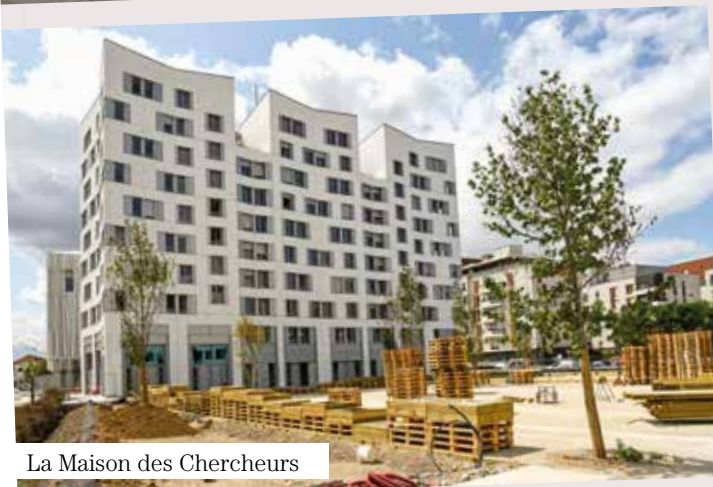
La Maison des Chercheurs

RÉSIDENCES UNIVERSITAIRES. Livrées. Deux résidences universitaires sont intégrées au campus, pour un total de 450 logements.