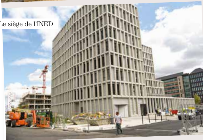
Le siège de l'INED