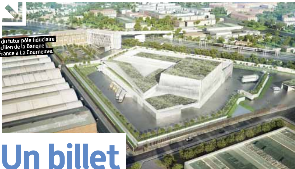
Vue du futur pôle fiduciaire francilien de la Banque de France à La Courneuve.