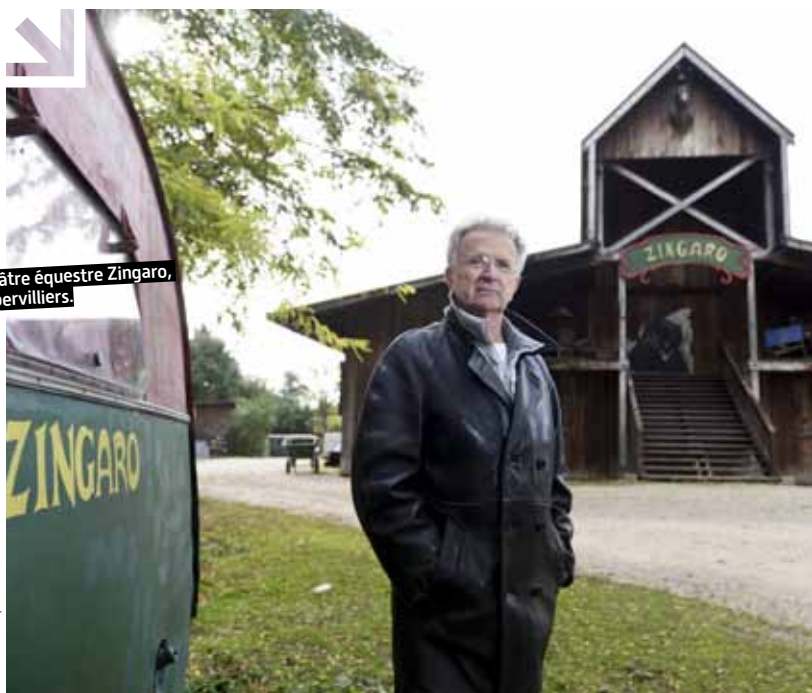
Théâtre équestre Zingaro, Aubervilliers.