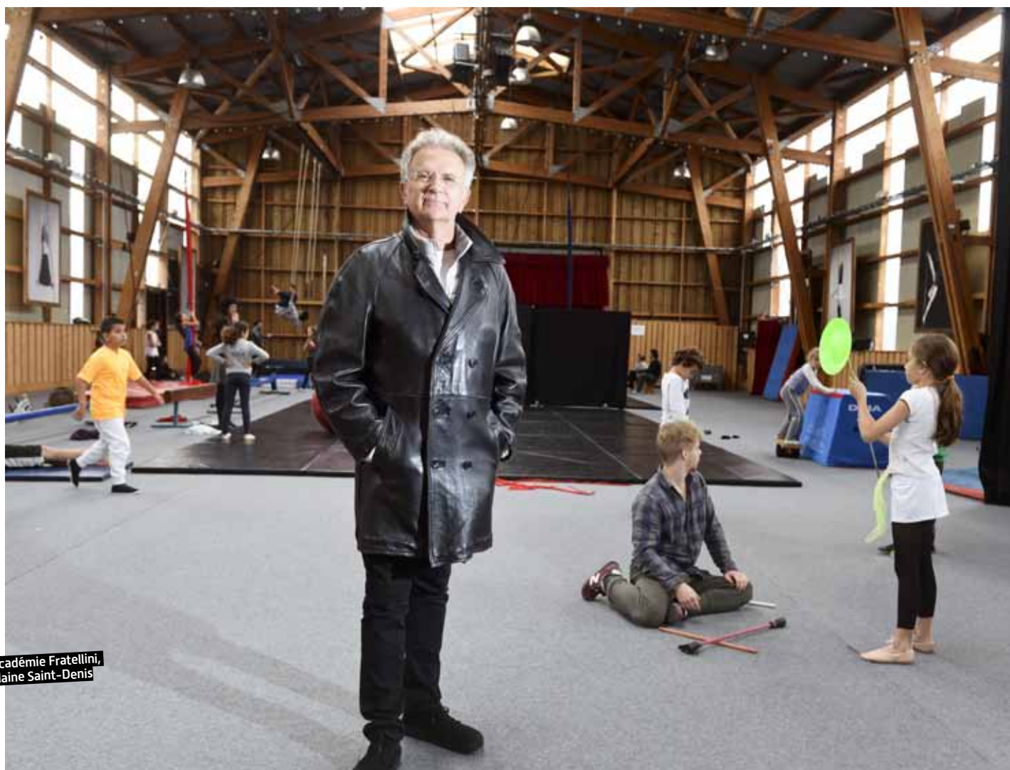
Académie Fratellini, Plaine Saint-Denis